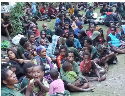
Situasi pengungsi dari Suanggama, Janambani dan Kulapa, Intan Jaya pada 16 Oktober 2025

Kasus Suanggama dan kampung-kampung sekitarnya menyebabkan ratusan warga—mayoritas perempuan, anak-anak, dan lansia—mengungsi dalam kondisi darurat. Banyak pengungsi meninggalkan rumah, kebun, ternak, dan sumber mata pencaharian tanpa kepastian waktu untuk kembali.